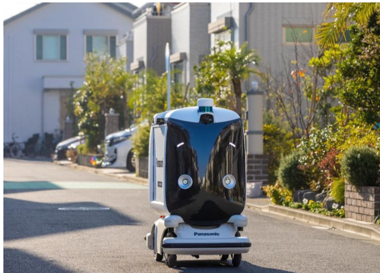
日本初の住宅街走行