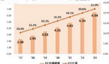
兆USドル 世界のBtoC-EC市場規模