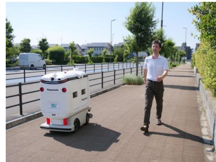
日本初の届出制に基づく運用