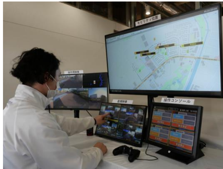
日本初のフルリモート型運用