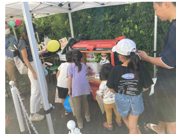
【カプセルトイ販売】