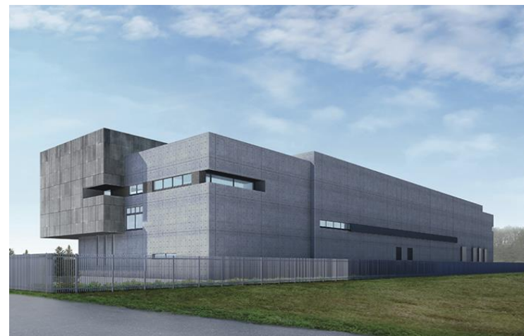
ゼロエミッションデータセンター完成予想図