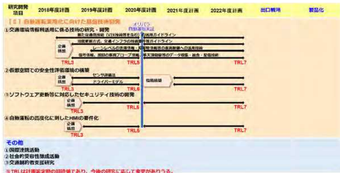
図表2-1. 研究開発のロードマップ