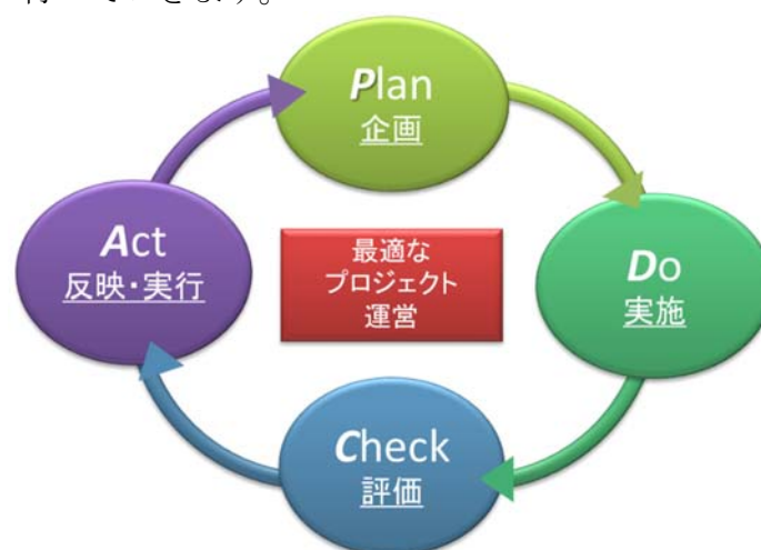
図1 研究開発マネジメントサイクル概念図

NEDO では研究開発マネジメントサイクル（図1）の一翼を担うものとして制度評価・事業評価を位置付け、評価結果を被評価事業等の資源配分、事業計画等に適切に反映させることにより、事業の加速化、縮小、中止、見直し等を的確に実施し、技術開発内容やマネジメント等の改善、見直しを的確に行っていきます。