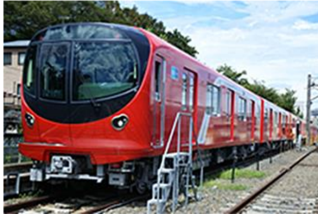
東京メトロ 2000 系新造車両

概要:一般的な鉄道車両で消費する電力量の約4割は補助電源システムで消費され、その大部分は空調装置による消費。そこで高耐圧 A11 SiC デバイスを開発し、補助電源を高効率・小型の高周波絶縁 DC/DC コンバータに代え、車内配電を交流から直流に変更し、空調装置のインバータにも A11 SiC デバイスを適用することにより高効率・小型化をはかった。本事業で開発した A11-SiC デバイスなどを、モータを制御する VVVF インバータ装置に適用し、2018 年度に東京メトロ丸ノ内線の 2000 系新造車両に導入。2019 年 2 月の営業開始以来、現行丸ノ内線 02 系 PMSM 車両と比較し、27%の消費電力量削減を実現。