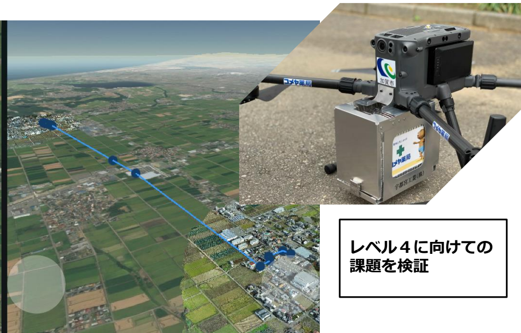
レベル4に向けての課題を検証