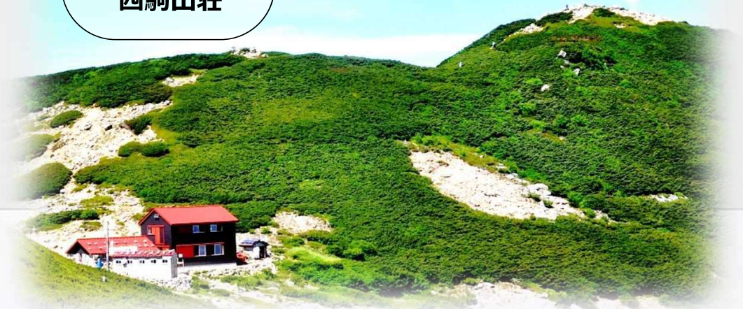
中央アルプス 西駒山荘