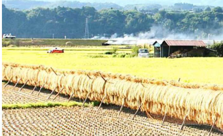
稲作・野菜・花卉等の複合経営