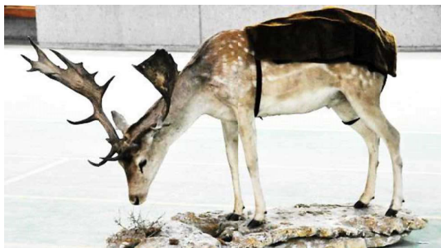
検知ターゲット（鹿の剥製） ハクキンカイロで体温を再現