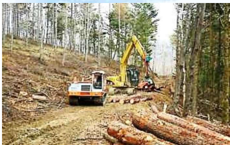
ソーシャルフォレストリー