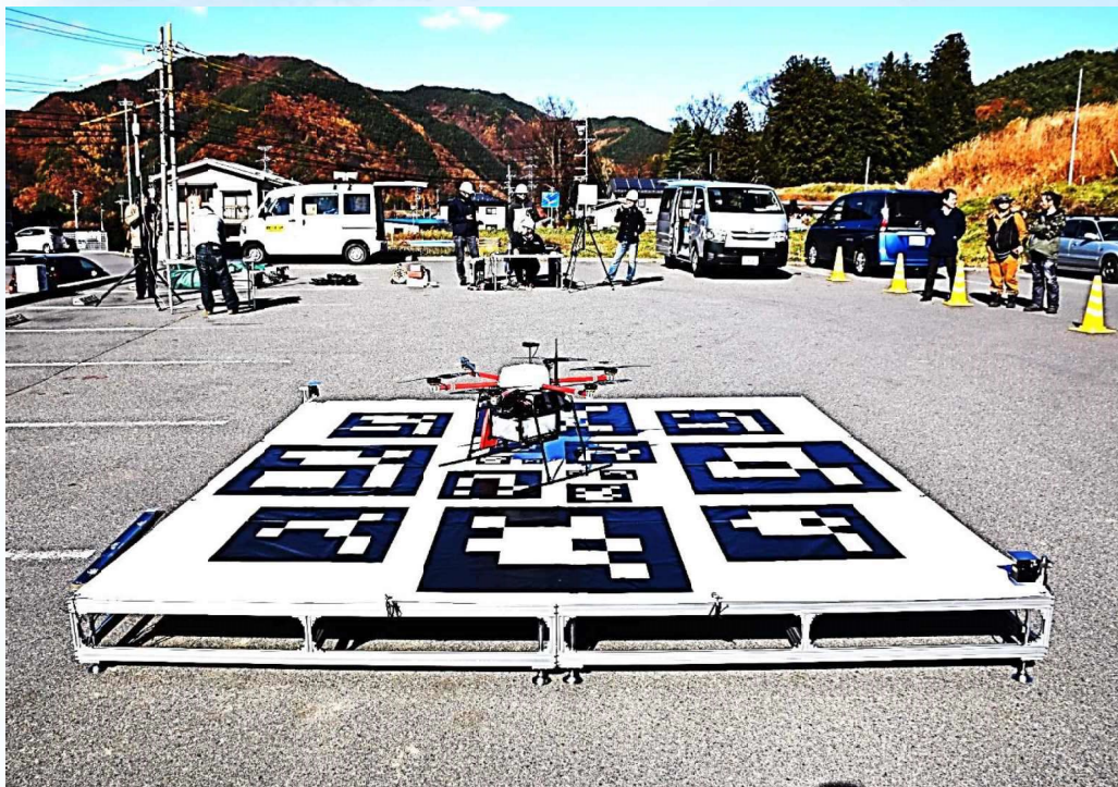
物流用ドローンポートシステム