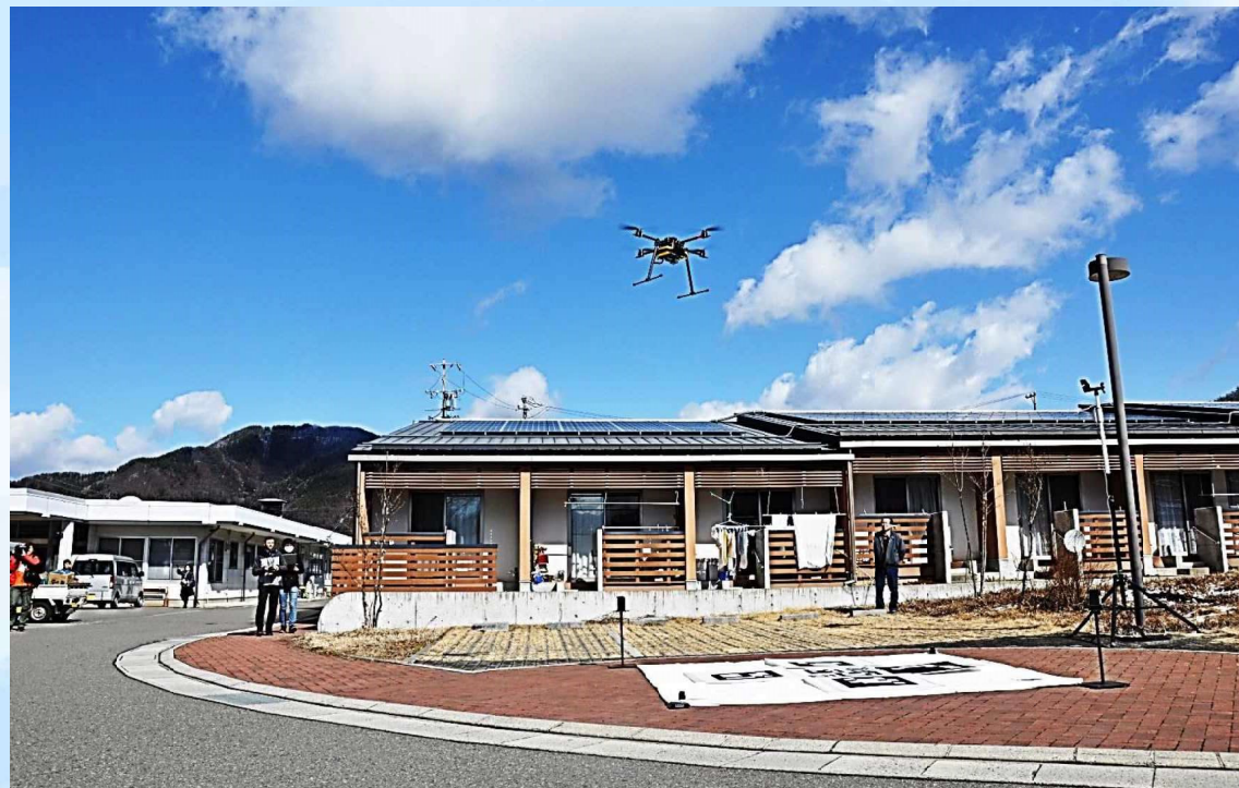
高齢者専用住宅への着陸