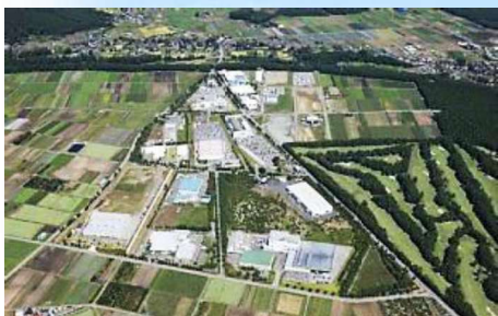
精密機器・食品産業等の集積