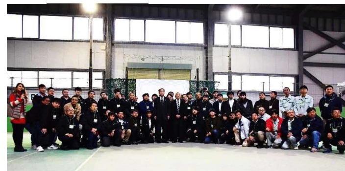
全国から選抜された14チーム参加