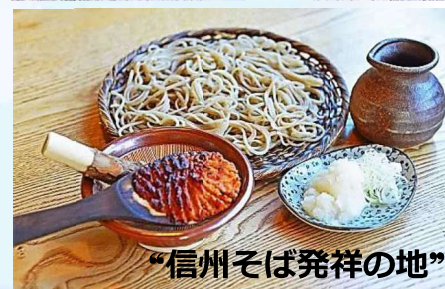
“信州そば発祥の地”