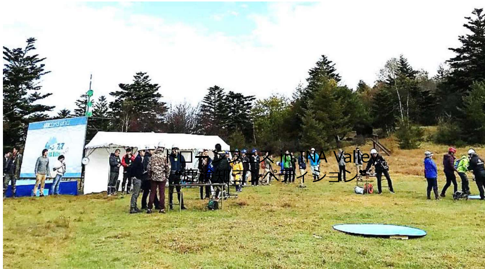
会場：伊那市長谷鹿嶺高原