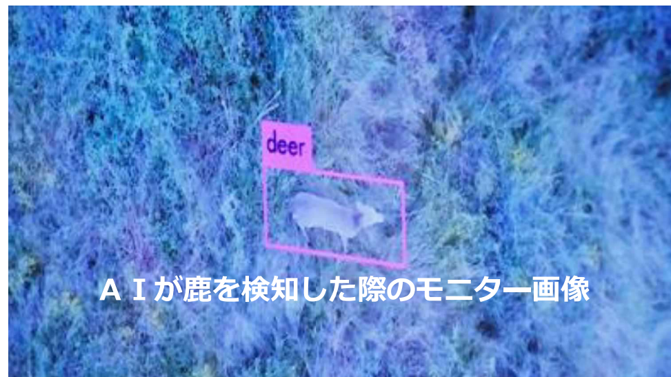
A I が鹿を検知した際のモニター画像