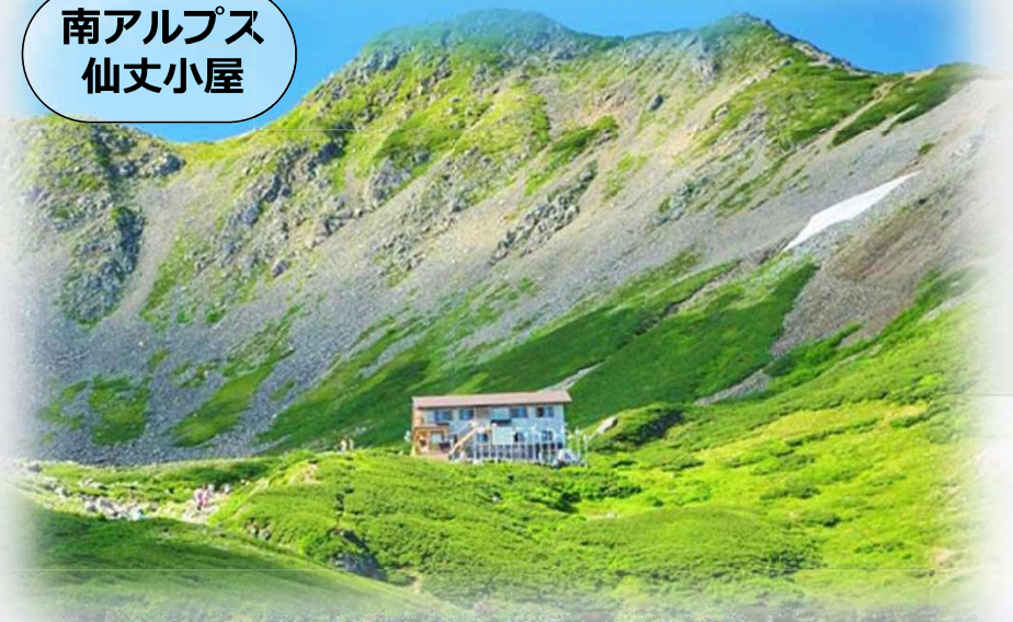
南アルプス 仙丈小屋