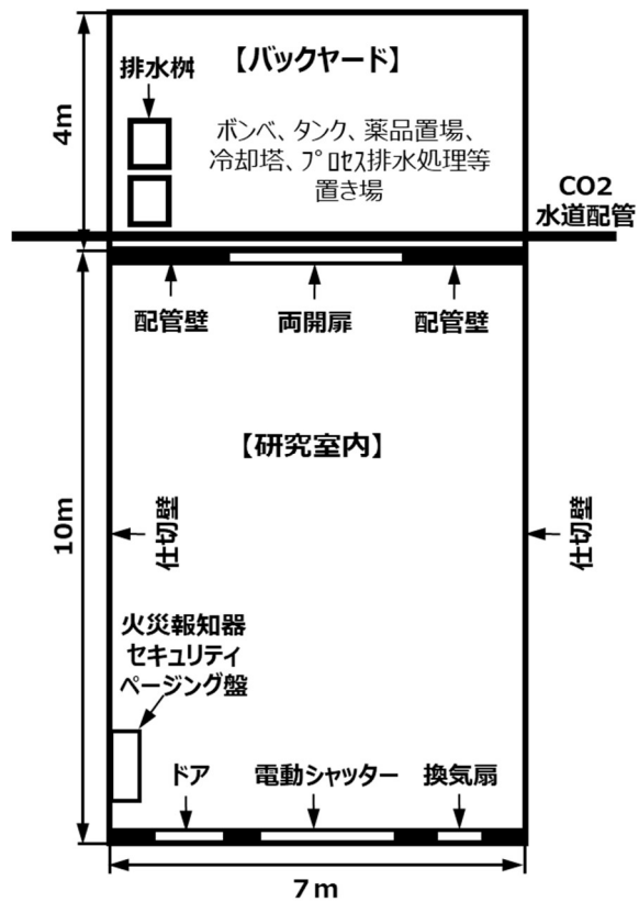
図 3 研究棟(研究室)の概略