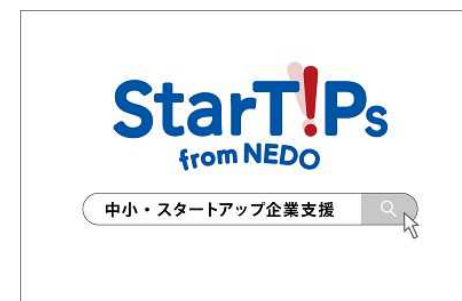
関連公式ホームページ