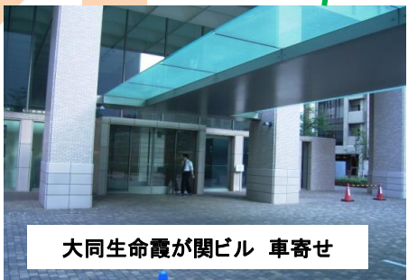
大同生命霞が関ビル 車寄せ

■ 交通 ・東京メトロ銀座線「虎ノ門」駅9番出口 徒歩3分 ・東京メトロ千代田線・日比谷線「霞が関」C2出口徒歩3分 ・JR新橋駅 徒歩15分