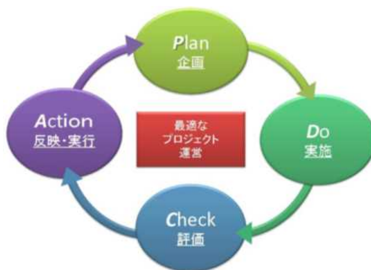
図1 実証マネジメントサイクル概念図

事後評価は、実証マネジメントサイクル（図 1）の一翼を担うものとして位置付け、評価結果を被評価事業等の資源配分、事業計画等に適切に反映させることにより、事業の加速化、縮小、中止、見直し等を的確に実施し、実証事業内容やマネジメント等の改善、見直しを的確に行っていきます。