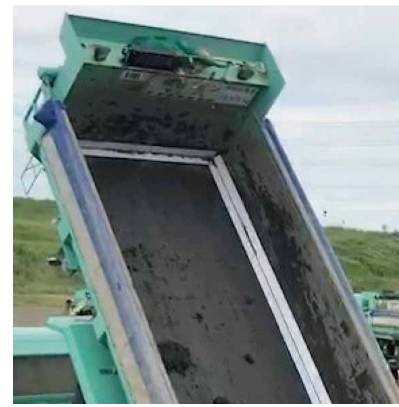
◀ 設置後：付着残土を解消