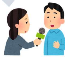
開発者ヘインタビュー