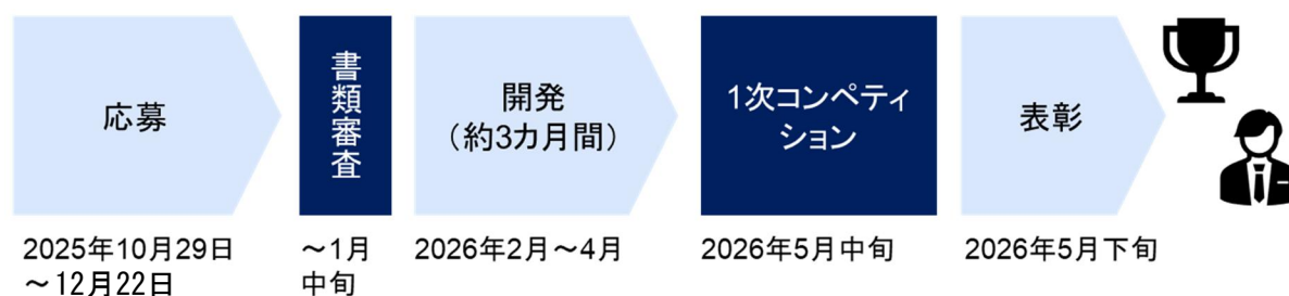
1次コンペティションの流れ