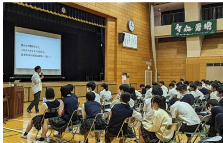
▲起業家教育出前授業の様子