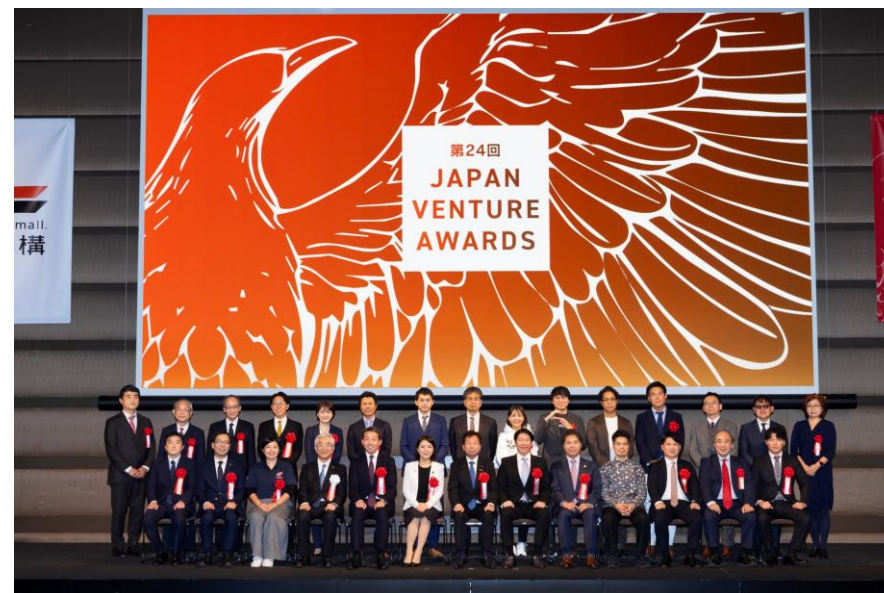
▲表彰式の様子（写真は第24回JVA）