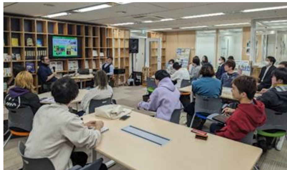
▲TIP * Sワークショップの様子